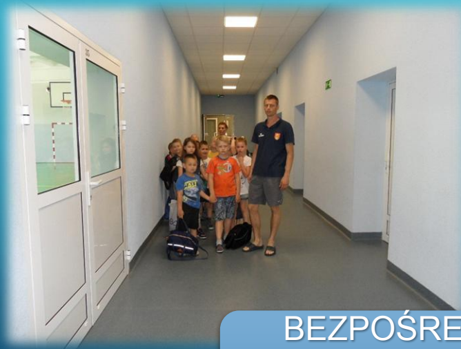
BEZPOŚREDNIE PRZEJŚCIE ZE SZKOŁY NA BASEN