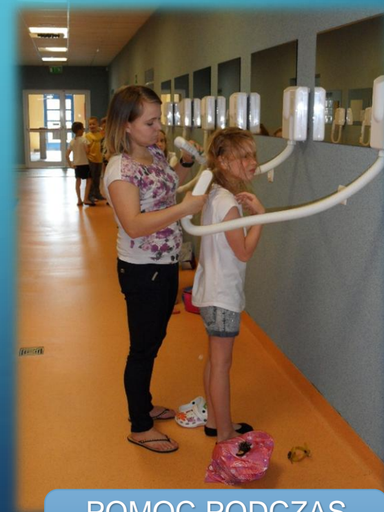
POMOC PODCZAS SUSZENIA WŁOSÓW